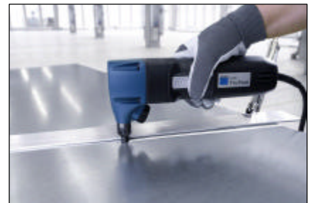
テンプレート切断