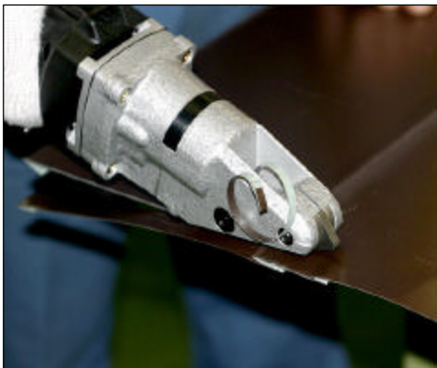
横葺成型材の切断

保持部はゴム素材により握りやすく使いやすい 横葺き板切断に最適です 葺いた後の重ね斜め切断が可能 切断面がキレイでひずみ・よじれが出にくい 回転刃の工具と比べて危険性がほとんどなく どなたにも簡単に使用できます 抜群の切断速度 8.5m/分 刃の交換は簡単で調整は不要 薄板の直線切断にも適します 便利な蓄電池の残量表示付き 蓄電池はスライド式リチウムイオンバッテリーの 採用により安全 更にパワー・作業量ともにアップ (当社比)