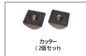
交換用の刃物 (製品には出荷時に1組装着されています)