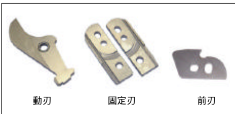
交換用の刃物 <標準タイプ>