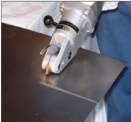
平板の角取り切断

保持部はゴム素材により握りやすく使いやすい 切断速度が速く薄板の直線切断に最適です 切断面がキレイで歪み・よじれがほとんど出ない 切断チップの切落しが出来るので安全で効率よく 作業が可能です 板厚 1mm以下の切断に適した別途注文品の 薄板用動刃があります ラスシート切断用の刃物として別途注文品の 動刃・チップガイドがあります 便利な蓄電池の残量表示付き 蓄電池はスライド式リチウムイオンバッテリーの 採用により安全 更にパワー・作業量ともにアップ (当社比)