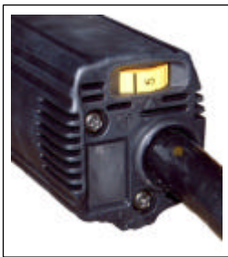
ストローク数設定ダイヤル