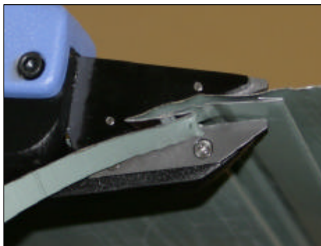
横葺成型材の切断